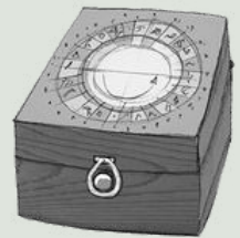
Illustration: Katrina Lange

Gemeinsam mit der Autorin werdet ihr eure Ideen zusammentragen. Wenn eure Phantasie so richtig am Sprudeln ist, heißt es, sich ein Blatt Papier zu schnappen und draufloszuschreiben: eure eigene kurze Geschichte .